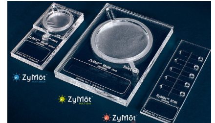
＜スパームセパレータ＞

化学物質や遠心分離機を使用せずに、短時間で良好な運動性精子のみを回収するデバイスです